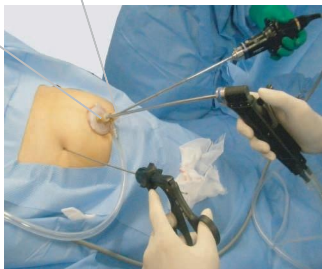
臍部開創器リデューサに本品を装着し、補助鉗子として「細径鉗子 Endo Relief」を使用。